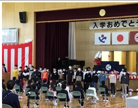
入学式（新入生を迎える言葉）