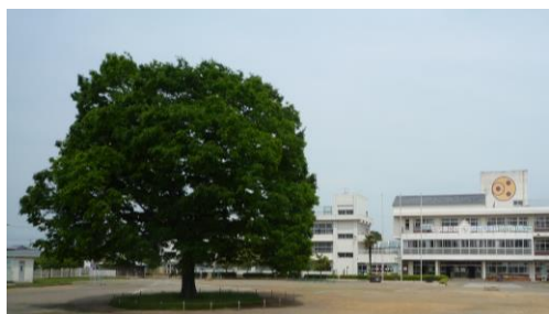
開校151年 明戸小の大けやき