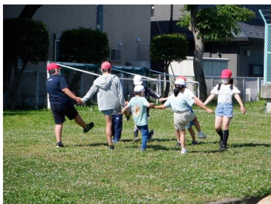
【たて割り活動】3年ぶりに再開です。