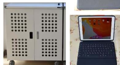
左: タブレット保管庫 右 上下: タブレット

「あけこの子」9月号でも書きましたが、タブレット使用にも知性と品性が大切になります。タブレットを文具のように使いこなせるのは「知性」のなせるわざ、学びのためのツールとして適切に使えるのは「品性」のなせるわざ。この「品性」の部分がモラルとなると思います。ご家庭でも「知性」と「品性」のある使い方ができるようご協力をお願いいたします。